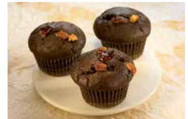
Europastry mini muffins m/ súkkulaði & jarðaberjasultu

28 gr. Magn í kassa: 80 Afbýða Vnr: 303010