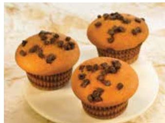
Europastry mini muffins m/ súkkulaði & karamellu

28 gr. Magn í kassa: 80 Afbýða Vnr: 303009