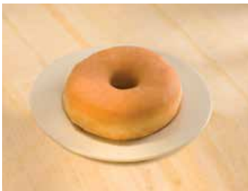
Europastry kleinuhringur plain

23 gr. Magn í kassa: 65 Fullbökuð vara, þarf aðeins að þýða upp. Vnr: 303034