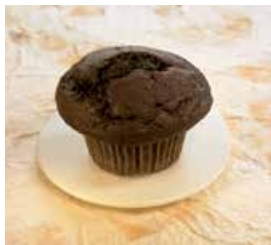
Europastry súkkulaðimuffins dökk

82 gr. Magn í kassa: 24 Afbýða Vnr: 303008