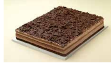
Europastry Svartskógar terta

1800 gr. Magn í kassa: 1 Afbýða Vnr: 303018